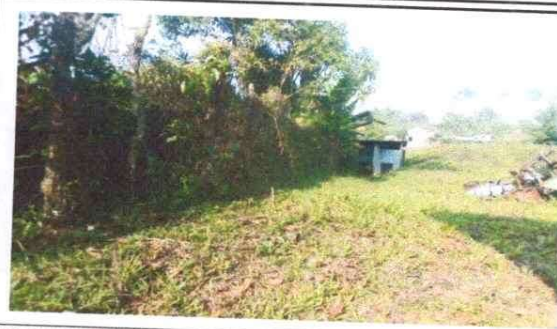
Foto 2: LUGAR DONDE SE CONSTRUIRÁ EL TANQUE DE CAPTACIÓN DE AGUA LLOVIZA DE 3 METROS.