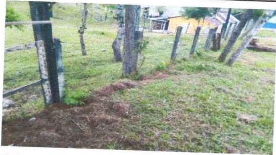
Foto 1: LUGAR DONDE SE COLOCARÁ O SE CONSTRUIRÁ EL MURO DE CONTENSION