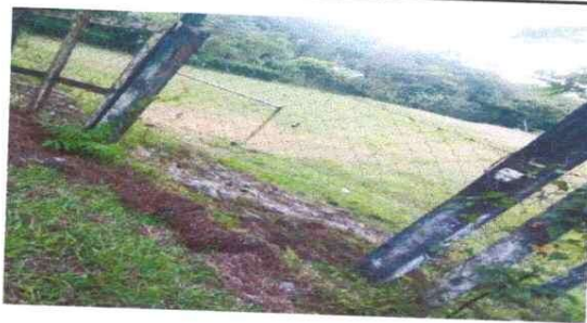
UNA PARTE DONDE SE COLOCARÁ LA CIRCULACION DE LA MALLA DEL PREDIO ESCOLAR.